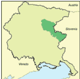
Julische Voralpen und Canin

Osservatorio Meteorologico Regionale via Natisone, 43 33057 Palmanova UD Tel. +39-0432-926831 meteo@arpa.fvg.it www.meteo.fvg.it